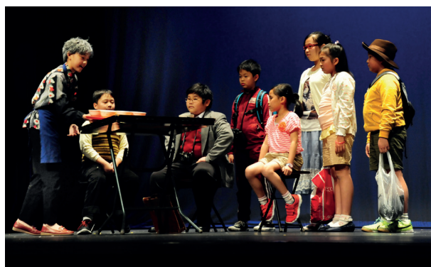
小學生的市區更新話劇表演令觀眾大感驚喜。

「我們學校位於深水埗，不少同學都曾經或正在居住於舊樓，對舊區更新有切身的體會。過去兩年，學校參加了市建局的不同教育活動，讓學生能鞏固所學，將經驗內化並建立同理心，以致學會體察別人，學習的成果對他們日後出來工作也很有幫助。我很欣賞市建局作為公營機構，有這份使命感推動更多人去了解舊區問題，關懷社區，讓市區更新能在社會上得以承傳及可持續發展。」