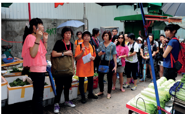
舊區導賞有助學生於探索中學習。