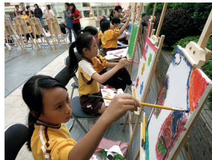
市建局支持文化藝術活動，讓舊區居民受惠。