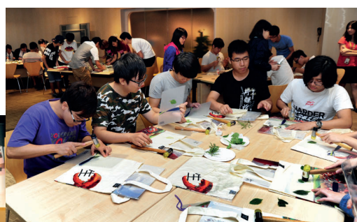
市區更新探知館舉辦的教育工作坊。