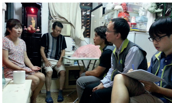
探訪「能源貧窮」住戶。